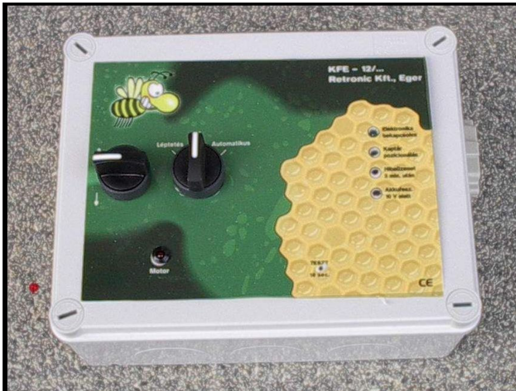
1. ábra A kaptárforgató elektronika fényképe. A kialakítás változhat a megrendelő igénye szerint